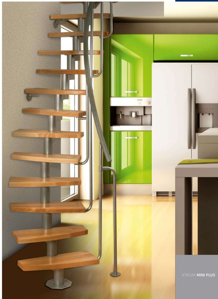
ATRIUM MINI PLUS